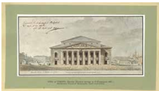
Ж.-Ф. Тома де Томон. Проект Большого театра в Санкт-Петербурге. 1802 г.