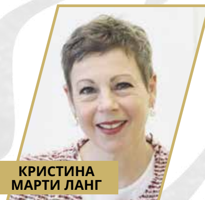
КРИСТИНА МАРТИ ЛАНГ

Исполнительный председатель Foster and Partners, президент Фонда Нормана Фостера, барон, член Ордена Заслуг.