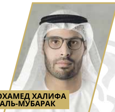
МОХАМЕД ХАЛИФА АЛЬ-МУБАРАК

Основатель и главный архитектор бюро Studio Libeskind, член жюри Премии Лазаря Хидекеля.