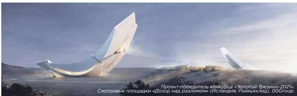
Проект-победитель конкурса «Золотой Трезини-2021». Смотровые площадки «Дозор над разломом» (Исландия, Рейкьяхлид), OOGroup.